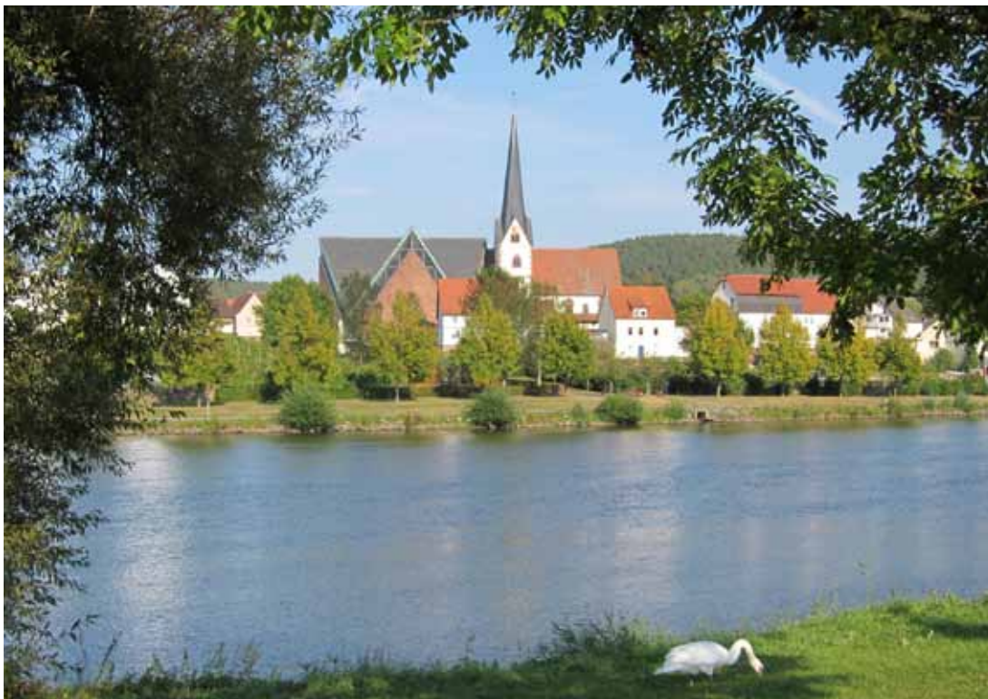
Bild 1 Ein idyllischer Blick auf das 1236 erstmals urkundlich erwähnte Erlenbach am Main und seine Pfarrkirche bietet sich vom gegenüberliegenden Wörth aus.

Was von Friedrich von Kesselberg noch überliefert ist 5 , vermittelt nicht gerade das Bild eines frommen Wohltäters der Kirche. Bei Insingen südlich von Rothenburg ob der Tauber besaß er Vogteirechte des Ansbacher Stifts St. Gumpert. Diese Position